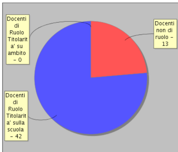
Distribuzione dei docenti per tipologia di contratto